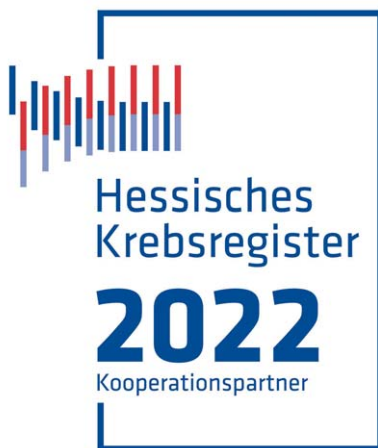
Abb. 2: Neues Siegel für Organkrebszentren

Hessische Organkrebszentren leisten mit regelmäßigen Meldungen einen wichtigen Beitrag zu einem vollzähligen und vollständigen Datenbestand im Krebsregister. Um ihre aktive Meldetätigkeit zu würdigen, stellt ihnen das HKR ab dem Meldejahr 2022 ein Siegel (Abb. 2) aus. Auf diese Weise können Organkrebszentren ihr Engagement bei der klinisch-epidemiologischen Krebsregistrierung sichtbar machen, beispielsweise auf der eigenen Website und in anderen Medien. Organkrebszentren erhalten das Siegel mit der Kooperationsbestätigung.